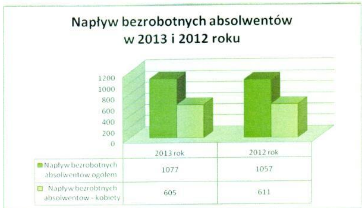
Wykres 2. Napływ bezrobotnych absolwentów w 2013 i 2012 roku.

Największy napływ bezrobotnych absolwentów odnotowano wśród osób bez zawodu. W roku 2013 zarejestrowano ogółem 501 absolwentów nie mających zawodu, co stanowiło 26,79% ogółu rejestracji osób bezrobotnych bez zawodu oraz 46,52% ogółu rejestracji absolwentów. W dalszej kolejności byli absolwenci z wykształceniem zasadniczym zawodowym – 22,19% ogółu rejestracji absolwentów oraz wykształceniem policealnym i średni zawodowym – 10,49% ogółu rejestracji absolwentów.