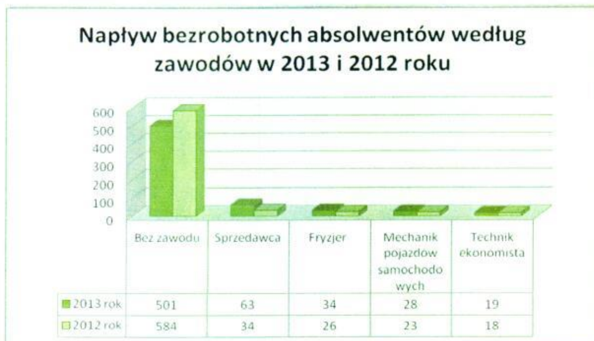
Wykres 3. Napływ bezrobotnych absolwentów według zawodów w 2013 i 2012 roku.

Wykres poniżej ilustruje porównanie napływu bezrobotnych absolwentów w 2012 i 2013 roku według zawodów, w których odnotowano największą ilość rejestrujących się absolwentów.