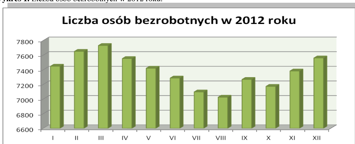
Wykres 1. Liczba osób bezrobotnych w 2012 roku.

Ilość osób bezrobotnych zarejestrowanych w Powiatowym Urzędzie Pracy w Gnieźnie według stanu na koniec każdego miesiąca ubiegłego roku przedstawia poniższy wykres.