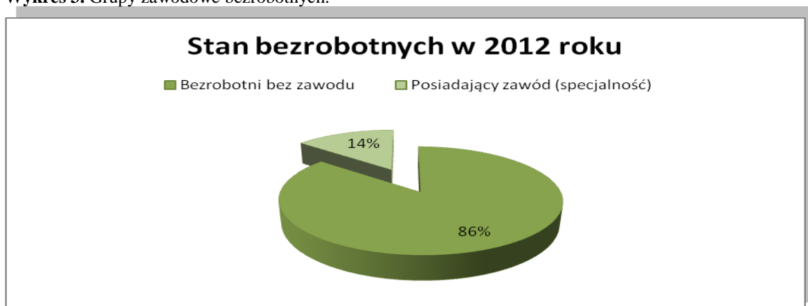
Wykres 3. Grupy zawodowe bezrobotnych.

Ilość osób bezrobotnych w powiecie gnieźnieńskim z uwzględnieniem podziału według zawodów w końcu 2012 roku przedstawia zamieszczona poniżej tabela. W tabeli zostały uwzględnione wyłącznie zawody, gdzie odnotowano rejestrację co najmniej 50 osób bezrobotnych w danej grupie.